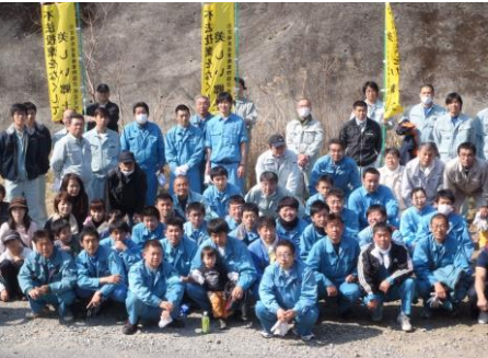
日曜日にもかかわらず、たくさんの人が 参加しました。 皆さん、お疲れ様でした。