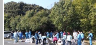
たくさんのゴミを 撤去しました。

す読年年 のん目度社 ででのの長 、貫突スの 宜え入タ換 しるし！撈 くよまトに おうすでも 願に。すあ い頑も。る ま張っーよ すつと南う すて皆風に いさ、 きんも2 まに36