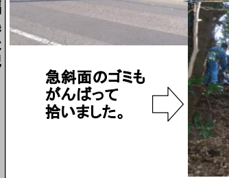
急斜面のゴミも がんばって 拾いました。