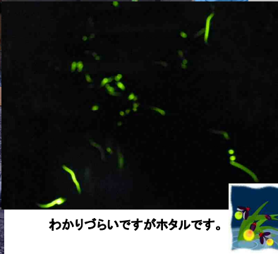
わかりづらいですがホテルです。

に飛来めしき しは、来年約た肉5 て地ぜすは1。会月 い域ひるも0従と1 き住参よつ0業員と6 たい民加うと人人員ホ のとしにホがとタル日 でので頑タ参、鑑に すふく張ル加そ賞社 。れだりがしの家を地 あさまたま家族行内 いすくし族行内 の。のさたをいで 場将ん。含ま焼