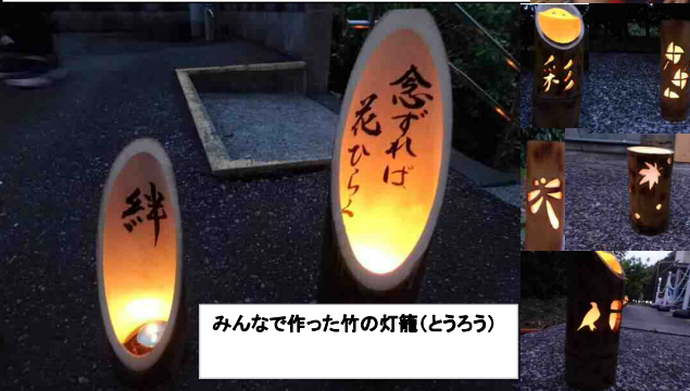
みんなで作った竹の灯籠(とうろう)