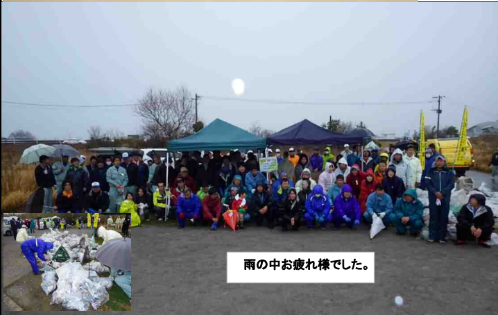
雨の中お疲れ様でした。