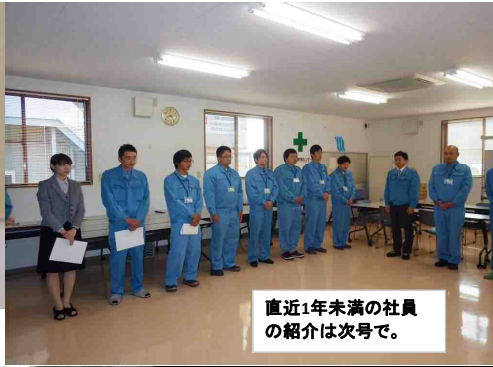
直近1年未満の社員の紹介は次号で。

平成27年4月1日に入社した社員が、南日本環境センターの社員として、自覚を忘れないで頑張ってください。